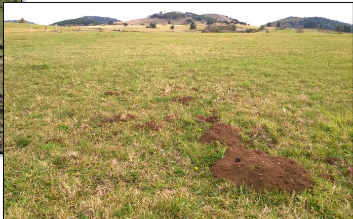
Indices de campagnol terrestre