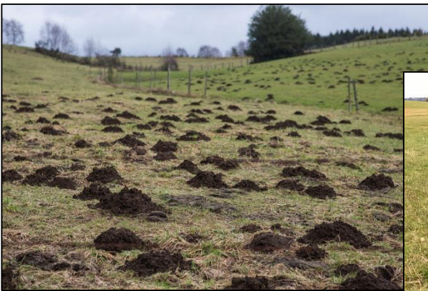
Indices de taupe